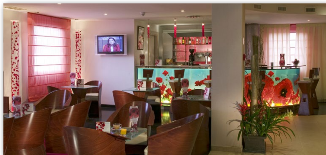
AVDA. SAN MARTÍN DE VALDEIGLESIAS, 4 / 28922 - ALCORCÓN

El ibis hotel en Alcorcón Tres Aguas está a 15 minutos del Centro de Madrid en transporte público. Igualmente, se encuentra a 7 km del Recinto Ferial de la Casa de Campo , el Zoo y el Parque de Atracciones.